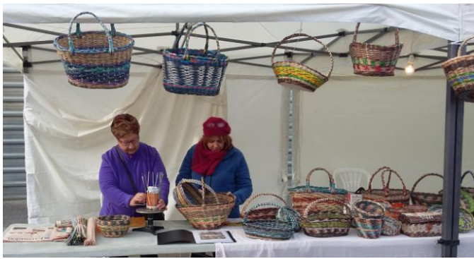
Ambient a la Fira de Santa Llúcia de 2015 per mago