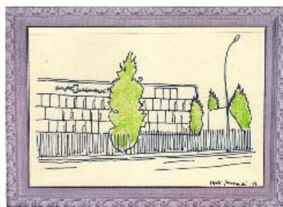
HOSPITAL DE ST. JOAN DESPÍ MOISÉS BROGGI