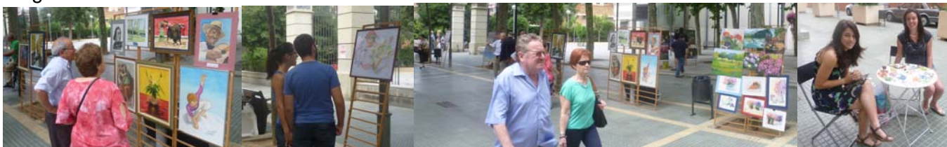
Assistents a la fira contemplant les obres de Mago i Ribó, vista panoràmica i dos noves exposidores mostrant les seves obres.