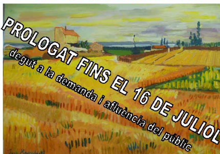
OLI 81X65 JORDI MERCADE

LLOC: AL RECINTE DEL VESTIBUL DE L'HOSPITAL DE SANT JOAN DESPÍ MOISÉS BROGGI