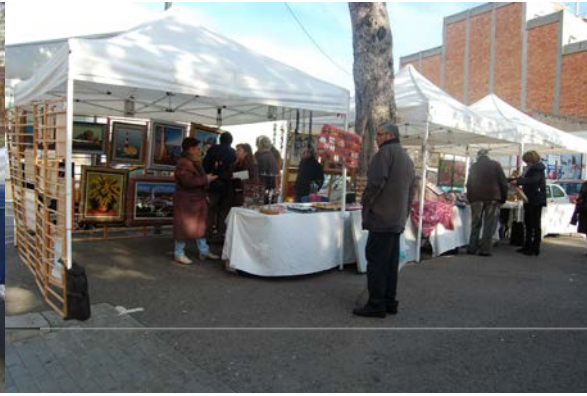
Estand del CADE