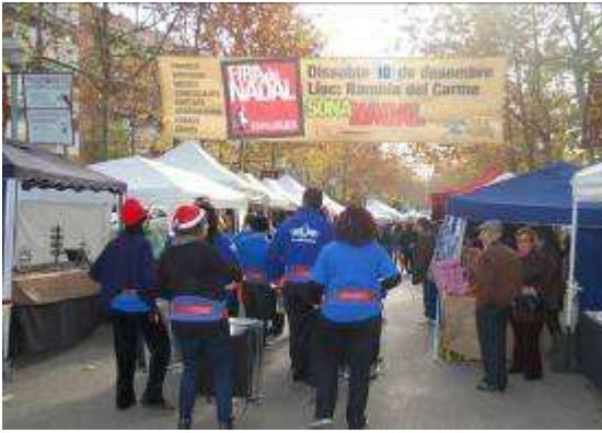
Cartell de la Fira i "xaranga"

Ara, veieu algunes imatges de l'exposició: