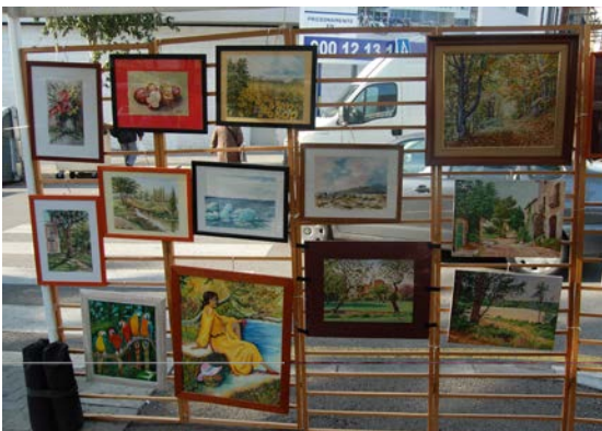
Lluisas Colomé i Babot