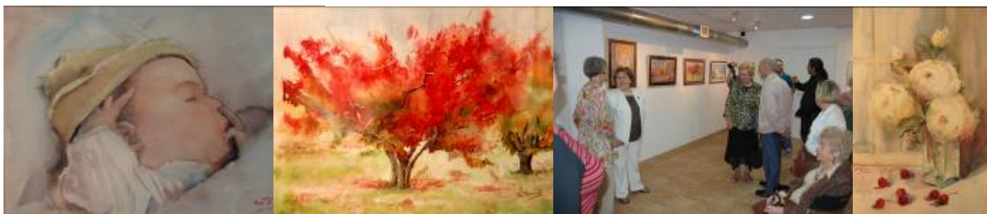
Algunes de les obres exposades i grup d'assistents a la inauguració – mago

Si s'hagués de qualificar l'exposició amb una sola paraula, aquesta seria: Perfecció.