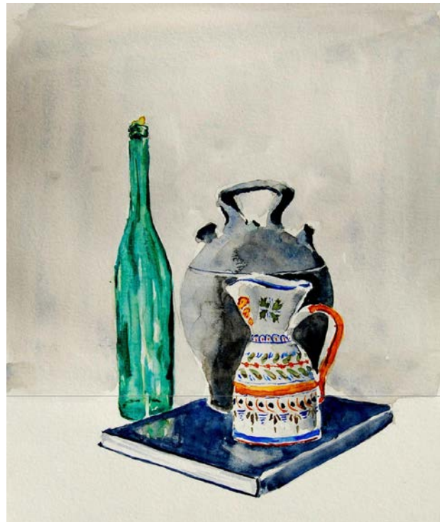
Aquarel·la realitzada per mago per la Fundació Caixa Penedès, per la mostra itinerant; 10 anys del CADE.