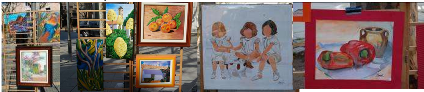
Els contrastos d'Antoni Forns, les coloracions de Joaquín Personal, les nenes de l'Ana Pallarés i el bodegó de Laura López

Quasi arribant a dos quarts d'una es munte l'aperitiu amb cava i refrescos, olives, “xips” i cacauets torrats, que compartim els que encara hi som, en bona germanor. Cap a les dues, cada ovella al seu corral... Fins al 27 de març!