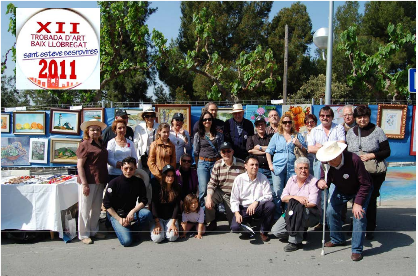
Unes fotos pel record