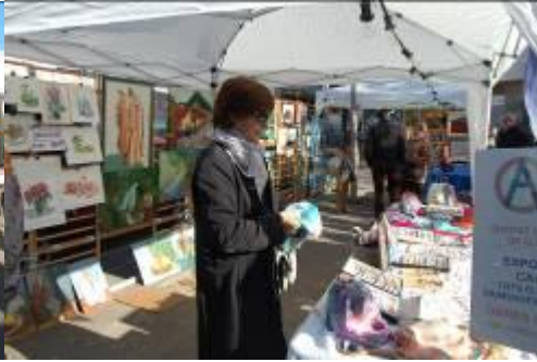
Vista general de l'Exposició de dia...