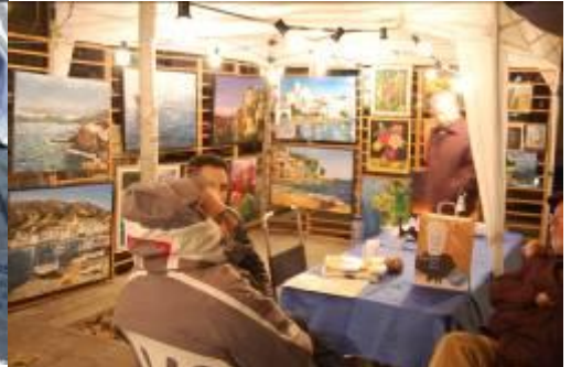
...i de nit.