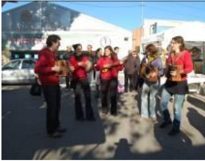
Una "xaranga" animant la Fira de Nadal