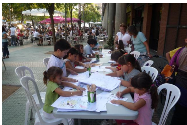
Més de 15 nens i nenes participaren en el taller