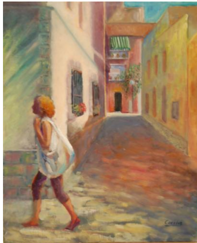
Cecilia de Rafael (oli)