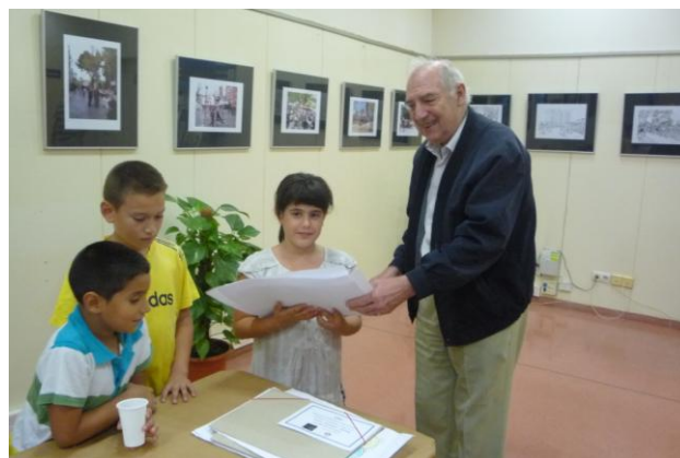
El nostre mestre de protocol lliurant els diplomes