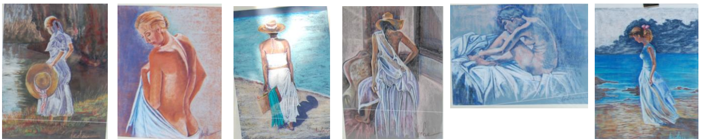
Obra de Sole Nicolau