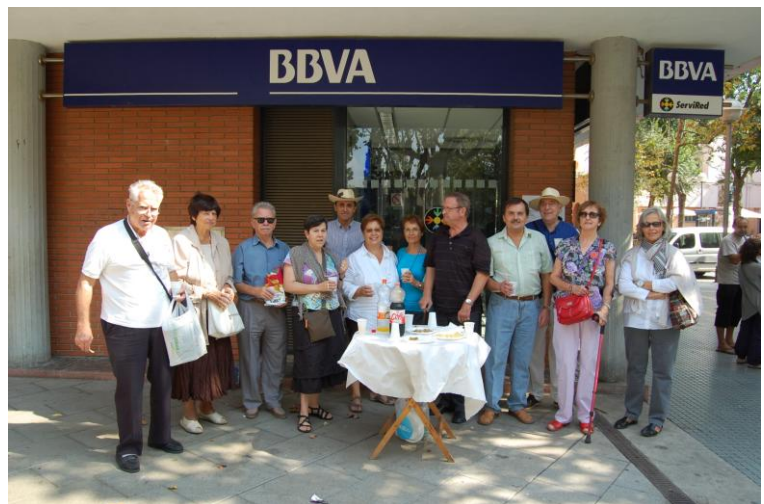
Tota la "troupe" celebrant l'inici de la Fira al Carrer