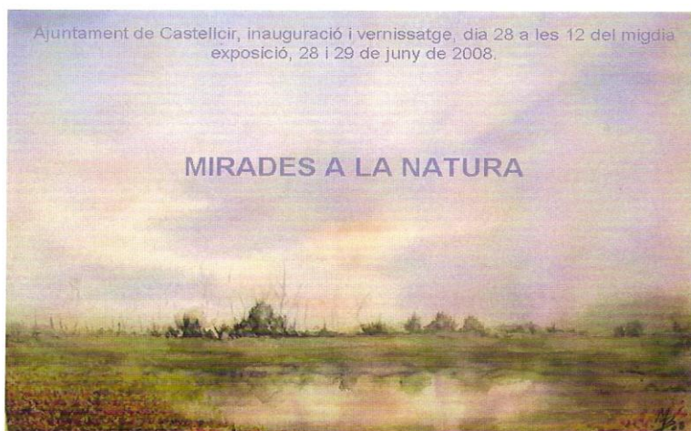
M a Mercè Blanch

Dels pastels de la M a Mercè tots heu pogut contemplar el seu treball ple de tons de color en les ombres, en les tres ultimes mostres col·lectives.