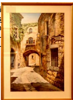
Dos aquarel·les característiques de Fernando Alegría.