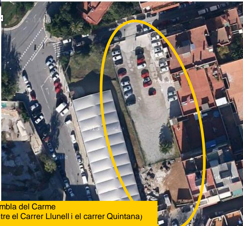
Rambla del Carme (entre el Carrer Lluell i el carrer Quintana)