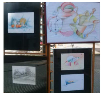
Dibuixos de Xavier Ribó